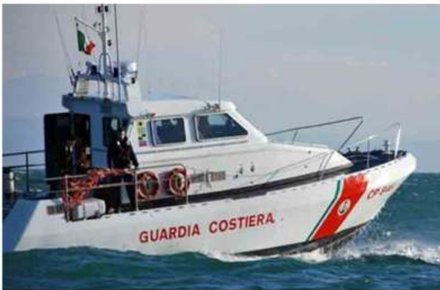
L'articolo è stato pubblicato il 3 agosto 2022 sulla NUOVA RIVIERA

L'uomo, fortunatamente con amici a bordo di una piccola imbarcazione, è stato colto da svenimenti