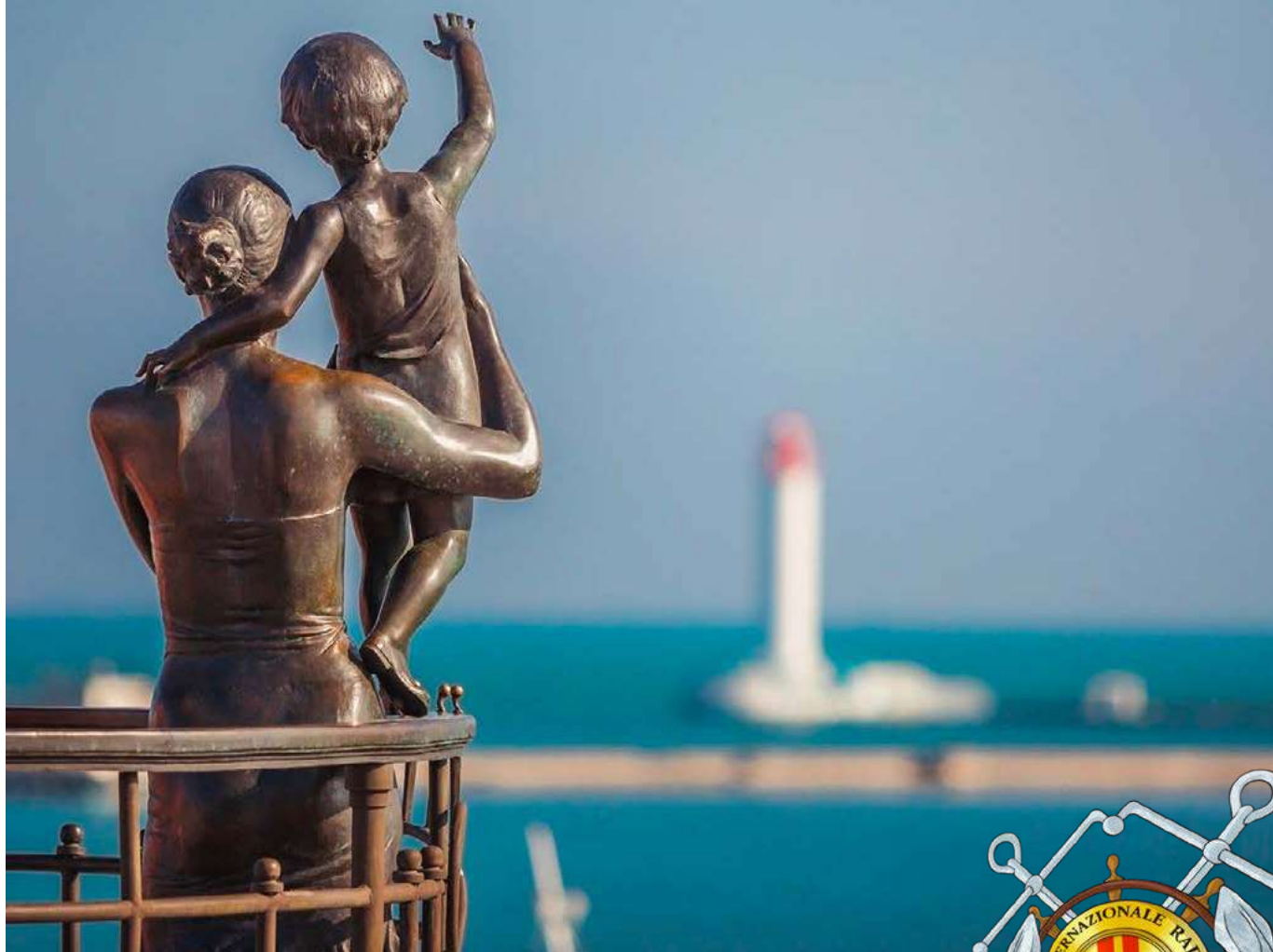
Statua " Moglie del marinaio" nel porto di Odessa